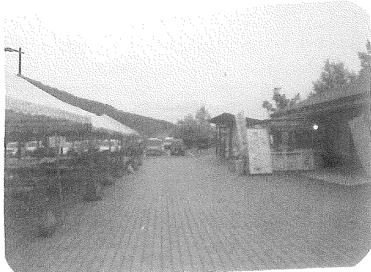
2015年度まごころ収穫祭会場 (道の駅:遠野風の丘)

本来は定休日なので、明日の「まごころ収穫祭」準備のため、午前9時から活動を始める。スタッフ74人、ボランティア