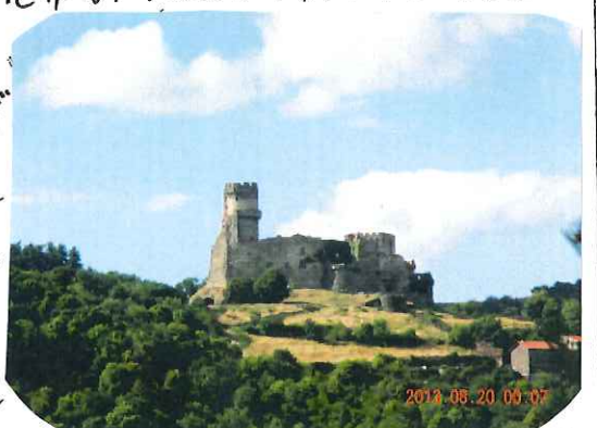
8/19(月) Volvic市(フランス)の古城。ボルヴィック

"Volvic"の発祥の地"エビアン"と並ぶニターカーらしいです。そのVolvic市の北の丘にある12~13世紀頃