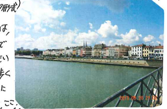
8/28(水) Macon市(フランス)の川沿いの美しい街並。

で終了する(マコン市にフランス新幹線が停車するので)川沿いの街で対岸からの眺めほすほらしいものでした。この村・町・市も美しいので、印象に残る街でした。