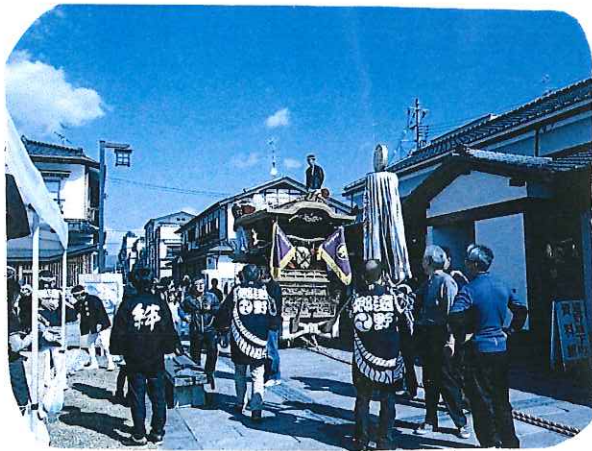
大阪府・岸和田市から来たダンジリ