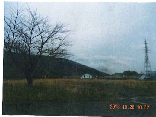
センターの直長の敷地 元にもあった浄化セ

来年に向けて、原発の影響で福島県飯沼村の特産品・ブランドであった“いいだて雪娘”がぼちぼちを栽培するために刈り取った草を一ヶ所に集める作業をしました。午前中12人(フランス・オレアンから駆けつけていたE先生1人、高校生6人、E含む)午後5人で活動しました。久しぶりの晴天でそう、さわやかな空気の下で汗を流しました。(遠野緑峰高校文化祭参加のため、午前・午後メンバー入れ替わり) 柿チャは、今年も見事にできあがり、傷がついたもののみ昨夜(10/26)、シチューをわけてもらい、ボランティアの皆さんと会食しました。震災後2年7ヶ月経ちましたが途切れることなく、ボランティアの力が来て下さる事を、本当に嬉しく思います。