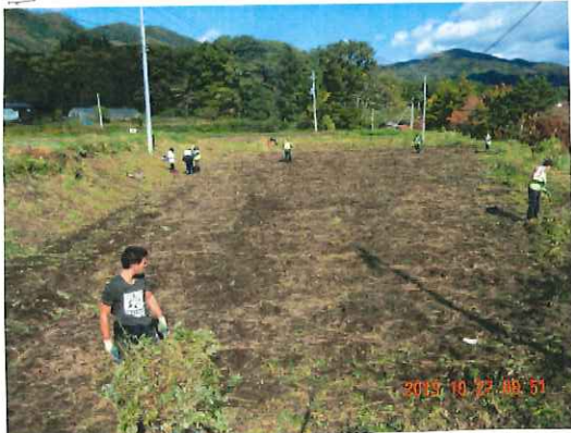
ボランティアチーム フランス・日本合同の 草を運び、集める。