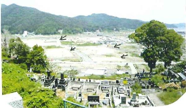
大槌町 城山から5%。PM1:30頃