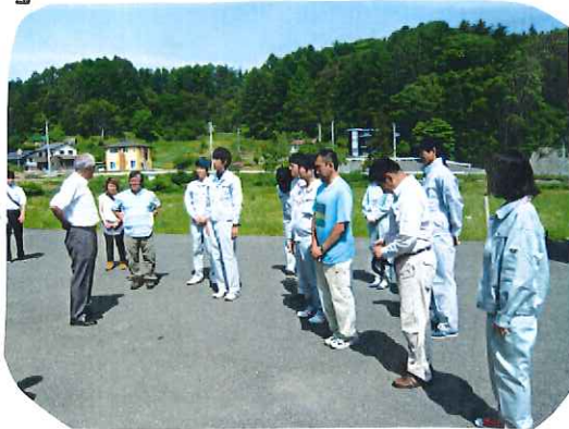
6/3 朝礼 人事院研修の人のボランティアの人

この事業は, 遠野まごころネット・釜石就業支援センターが釜石市内の被災者で切実な軽度障害者と共に作っていくものになるようです。(釜石まごころの郷) 執筆