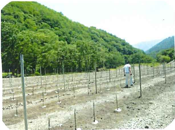
6/2 午前, 撮影