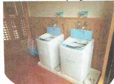
全自動洗濯機 2台(有料予定)