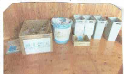
ゴミの燃えるゴミ、②ペットボトル ③缶(アルミ、鉄)