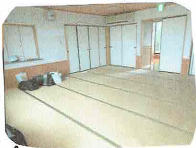
↑男性部屋18畳(女性用も同じ)

5/26(木)、菊池市にある遠野まごころネットが運営にたずさわるボランティアセンターに入った。HPで外観は知っていたが恵まれた施設を貸与してもらったものと驚いた。施設・設備としては