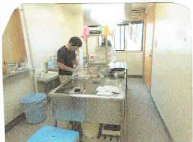
↑調理ができます(電子コンロ)

まず、このボランティアセンターから自治体(伊達城市とか西郷)のボランティア受付センターに行き、他のボランティアの方と合流。一緒に説明を受け、現場に行く。東日本大震災と異なる点は、瓦礫撤