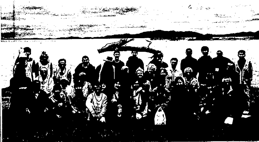
昇竜の松をバックに35人の研修参加者 場所は 気仙沼市 波路上岩井崎 まで。

(2) たくじんが「坂本さん、大船渡、陸前高田、気仙沼と、視察研修の後、ドライブ」に行ってみないか? と声をかけてくれました。そのドライブで見た景色を少し書いてみた。と書いてます。